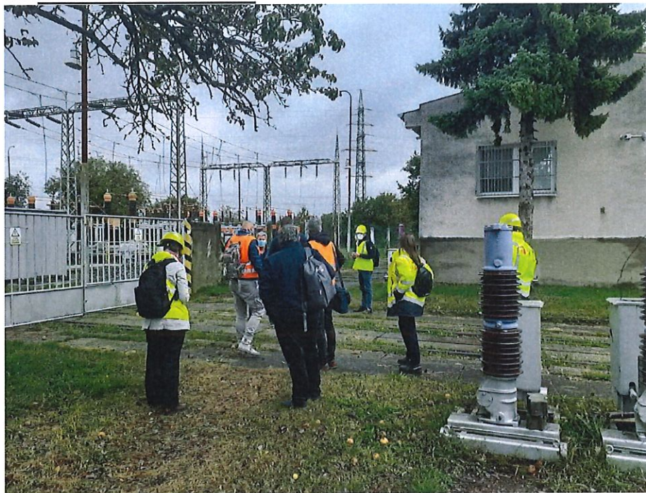
Obhliadka TNS Zohor