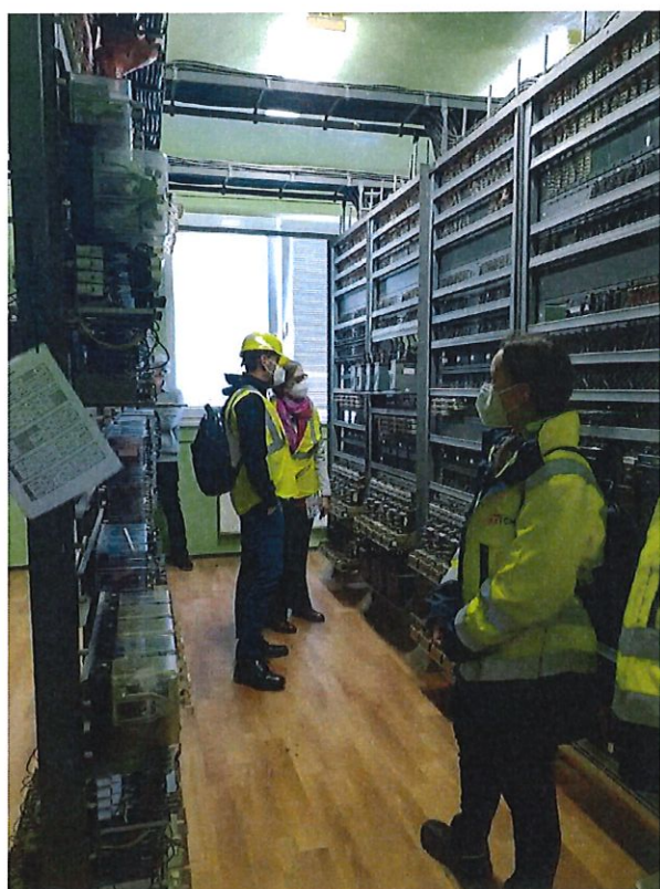
Obhliadka Zabzar žst. Kúty